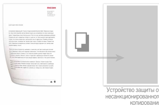
Устройство защиты от несанкционированного копирования