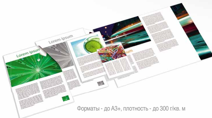
Форматы - до А3+, плотность - до 300 г/кв. м

Aficio™MP C6000SP/MP C7500SP поддерживают широкую линейку носителей для создания отчетов, раздаваемых материалов или листовок. Устройства легко работают с бумагой формата до А3+ и плотностью до 300 г/кв. м, а также прозрачными пленками для проектора. Вы можете печатать корпоративные бланки в вашем офисе без аутсорсинга.